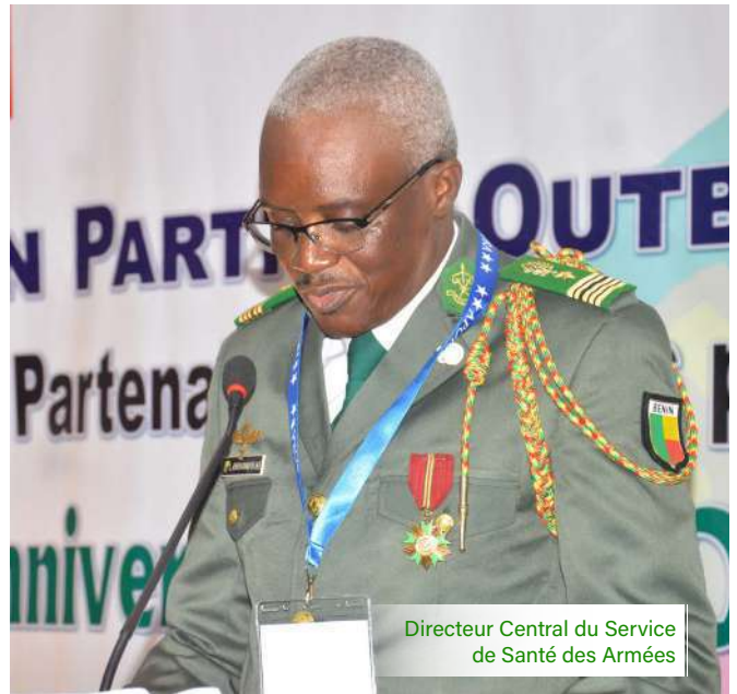
Directeur Central du Service de Santé des Armées

L'hôtel AZALAI de la plage de Cotonou a abrité les travaux de la conférence. La cérémonie d'ouverture le 4