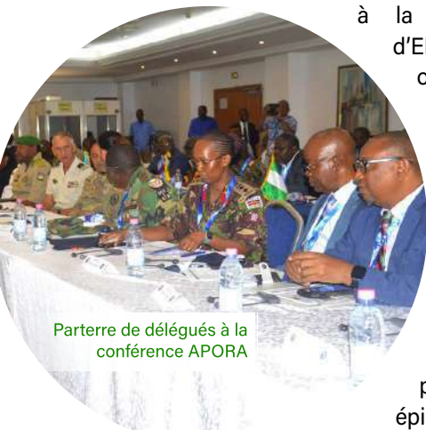
Parterre de délégués à la conférence APORA